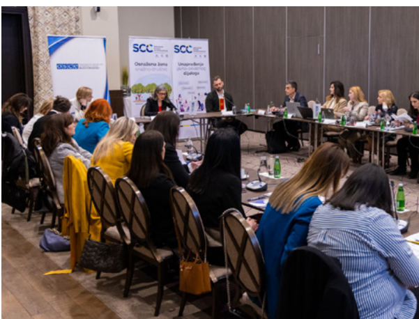
Okrugli sto "Dijalog na temu rodno odgovornog budžetiranja", u organizaciji SCC i Misije OSCE u Crnoj Gori, 25.04.2023.g, Podgorica