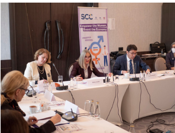
Okrugli sto "Rodna ravnopravnost i rodno odgovorno budžetiranje", organizovan od strane SCC i Državne revizorske institucije, 15.02.2022.g, Podgorica