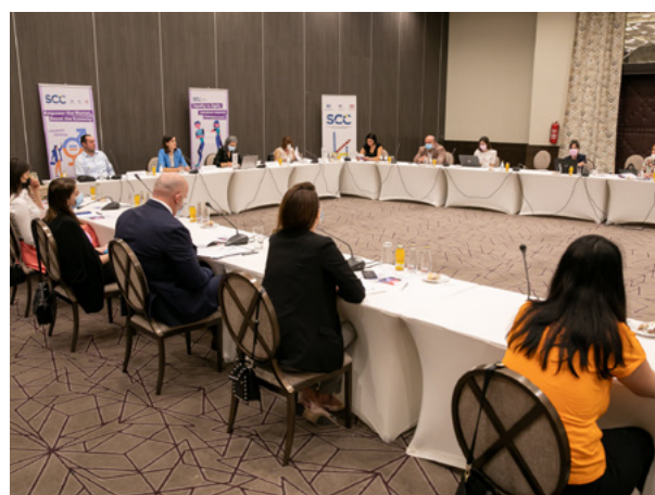
Radionica na temu uvođenja rodno odgovornog budžetiranja u crnogorski sistem, 10.09.2021.g, Po- dgorica