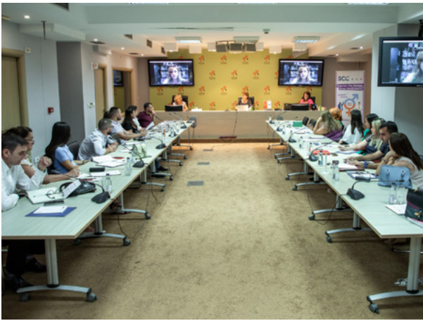
Radionica "Rodno budžetska izjava", u organizaciji SCC i Misije OSCE u Crnoj Gori, a na inicijativu Ministarstva finansija, 19.07.2022.g, Podgorica