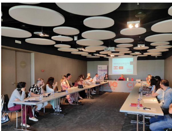
Radionica na temu rodno odgovornog budžetiranja, u organizaciji SCC i Misije OSCE u Crnoj Gori, 06.06.2022.g, Podgorica