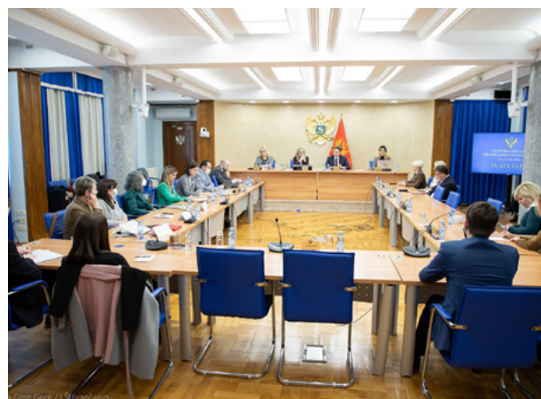
17. sjednica Odbora za rodnu ravnopravnost Skupštine Crne Gore na temu rodno odgovornog budžetiranja i uloga Državne revizorske institucije, 01.03.2022.g, Podgorica