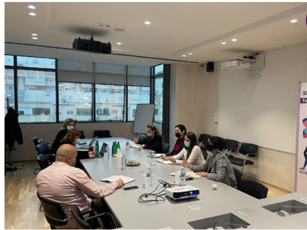
Sastanak SCC, Ministarstva ekonomskog razvoja i Međunarodne organizacije rada, s ciljem pokretanja inicijative obračuna rodno jaza u zaradma od strane MONSTAT-a, 22.11.2021.g, Podgorica