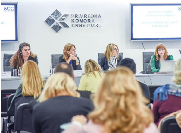
Sjednica Koordinacionog odbora za žensko preduzetništvo- Promocija dana ženskog preduzetništva, 19.11.2021g, Podgorica