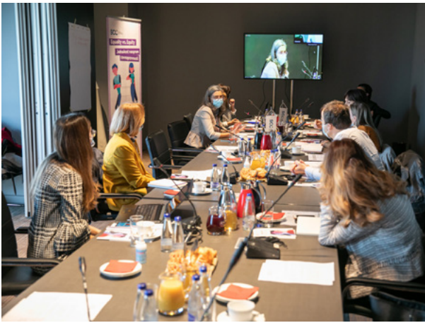
Radionica na temu uvođenja rodne dimenzije u proces javnih nabavki, 17.11.2021.g, Podgorica