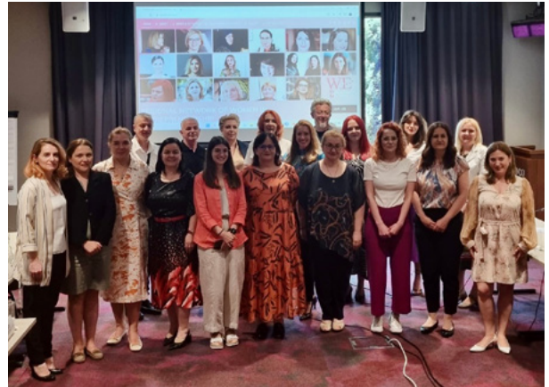
Radionica Radne grupe za industrijski razvoj u okviru Regionalne mreže žena u preduzetništvu, u organizaciji RCC, 28.06.2023.g, Podgorica