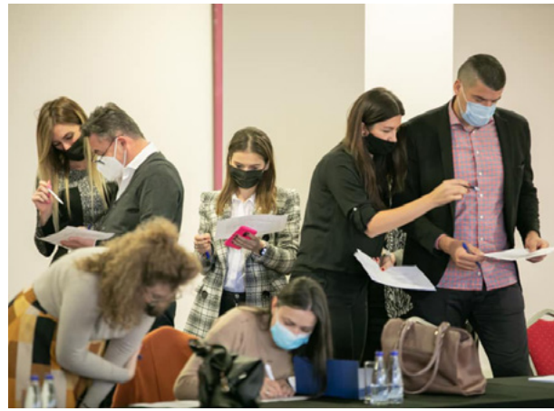
Radionica na temu rodno odgovornog budžetiranja, u organizaciji SCC i Misije OSCE u Crnoj Gori, 19.11.2021.g, Podgorica