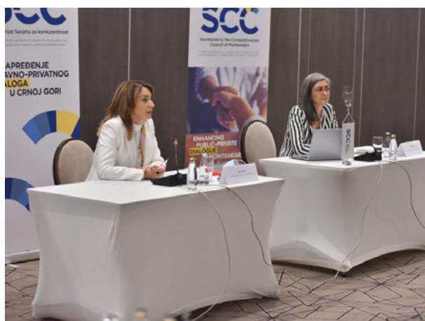
Okrugli sto u okviru javne rasprave o Nacrtu strategije unapređenja politike javnih nabavki i javnopri- vatnog partnerstva, 26.05.2021.g, Podgorica

SCC je u prethodne tri godine ostvario izuzetno uspješnu saradnju sa partnerima na temu ekonomskog osnaživanja žena i promocije rodne ravnopravnosti. Tokom ovog perioda implementirane su brojne inicijative u pogledu organizacije konferencija, okruglih stolova, radionica i drugih oblika dijaloga. Neki od njih su bili organizovani od strane Sekretarijata, dok su na drugim predstavnicima SCC uzeli aktivno učešće na panel diskusijama ili na drugi način učestvovali na događajima sa rodnom misijom. Sve ove aktivnosti su imale za cilj promovisanje ključnih principa rodne ravnopravnosti, podsticanje razmjene najboljih praksi i iskustava, kao i stvaranje povoljnog okruženja za žene u sektoru ekonomije. Saradnja kroz zajedničke kampanje značajno doprinosi stvaranju uslova za dalji napredak u ostvarivanju cilja jačanja ekonomske pozicije žena i dostizanja rodne ravnopravnosti.