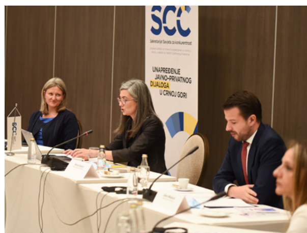
Okrugli sto "Rodna ravnopravnost i ekonomsko osnaživanje žena", 16.06.2021.g, Podgorica