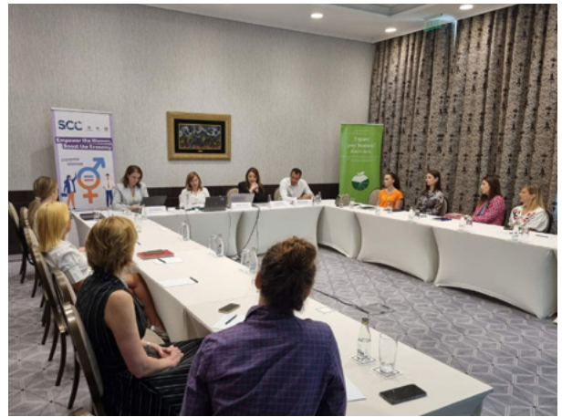
Radionica "Unapređenje rodne ravnopravnosti u poslovanju srednjih i velikih preduzeća", u organizaciji SCC i Evropske banke za obnovu i razvoj (EBRD), 02.06.2022.g., Podgorica