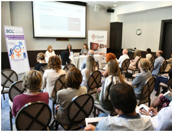
Okrugli sto u okviru javne rasprave o Nacrtu zakona o izmjenama i dopunama Zakona o javnim nabavkama, u organizaciji SCC i Ministarstva finansija, 20.05.2022.g, Podgorica