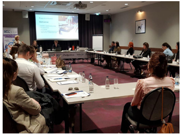
Obuka predstavnika javne uprave na temu rodno odgovornog i programskog budžetiranja, u organizaciji SCC i Misije OSCE u Crnoj Gori, 11.05.2022.g, Podgorica