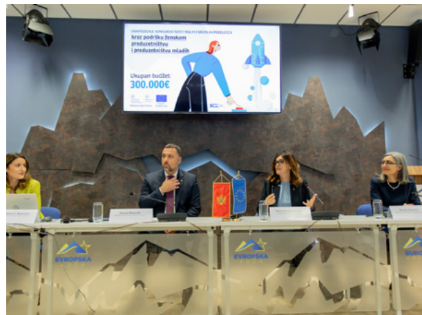
Prezentacija grant šeme "Unapređenje konkurentnosti malih i srednjih preduzeća kroz podršku ženskom preduzetništvu i preduzetništvu mladih", 22.11.2022.g, Podgorica